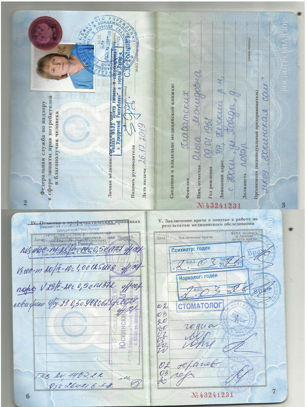
Повар, Главатских О.Л., прививка от гриппа поставлена, от COVID на момент проверки прививка тоже имелась.