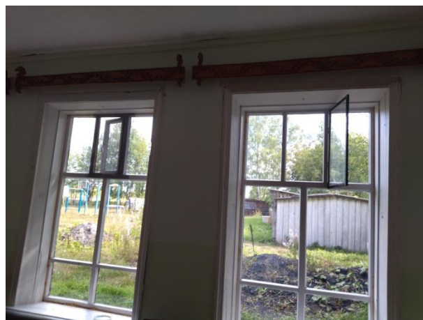
Сделаны дополнительные форточки